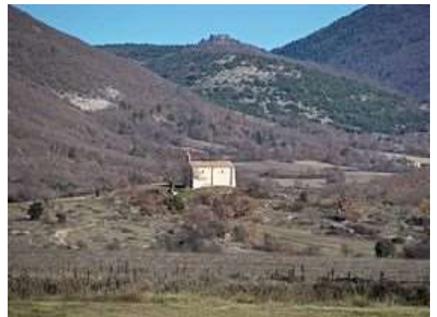
Le Chastelard dominant la chapelle Saint-Michel de Bertranet

Avec l'aimable autorisation de Patrick Ollivier Elliott – Éditions Edisud